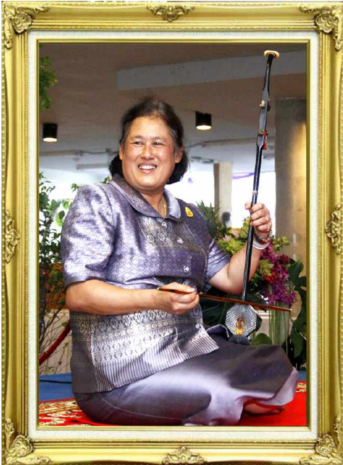
สมเด็จพระกนิษฐาธิราชเจ้า กรมสมเด็จพระเทพรัตนราชสุดาฯ สยามบรมราชกุมารี เสด็จพระราชดำเนินทรงเปิดป้ายสถาบันการเรียนรู้เพื่อปวงชน ตำบลบางคนที อำเภอบางคนที จังหวัดสมุทรสงคราม เมื่อวันศุกร์ที่ 15 มิถุนายน 2555